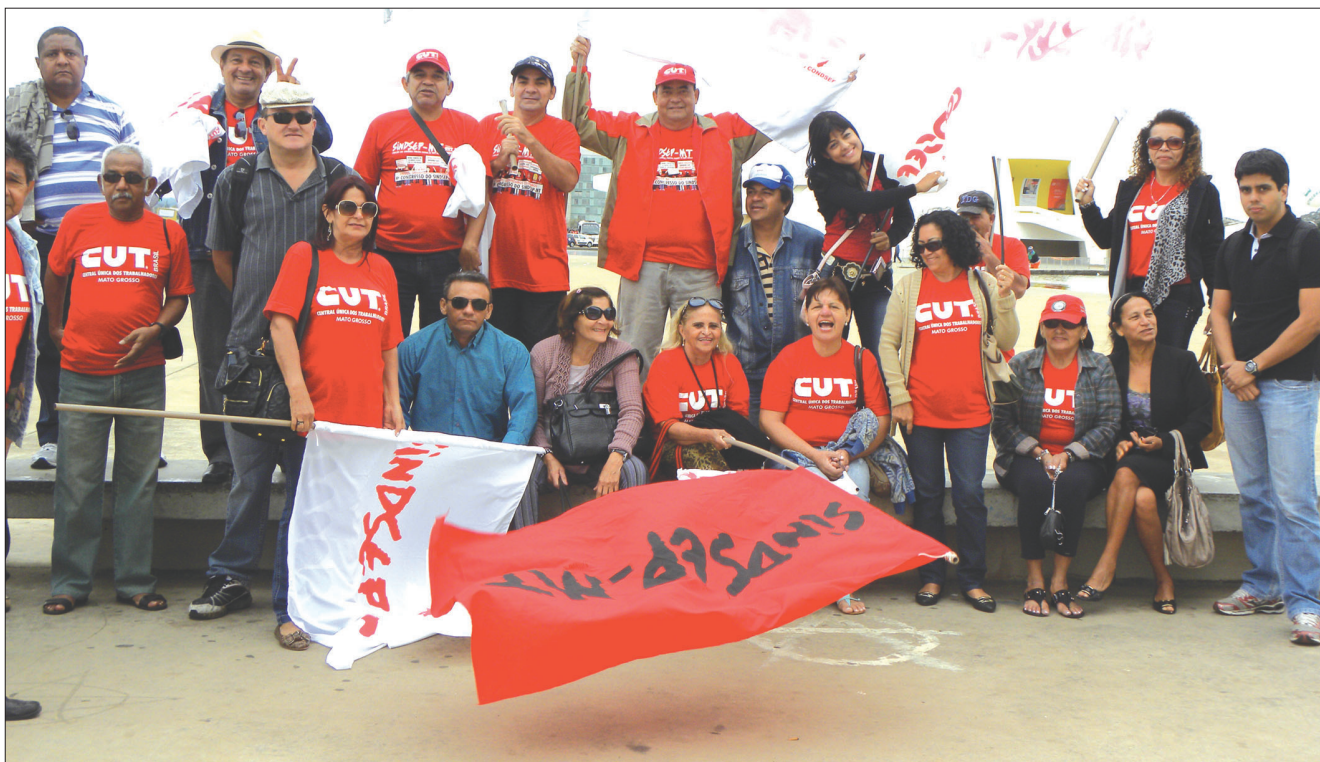
Caravana do Sindsep-MT para o acampamento na Esplanada dos Ministérios. No dia 18 de julho aconteceu mais uma marcha em Brasília

ter a oportunidade de analisar as propostas para que haja possibilidade de se buscar um acordo nas negociações. O maior temor é que se repita o que ocorreu em 2011 quando o governo enviou somente no dia 31 de agosto um projeto de lei ao Congresso que terminou se transformando na MP 568/12. A MP continha itens que sequer foram negociados com os servidores, um dos motivos que levou a medida a ter mais de 450 emendas anexadas na tentativa de corrigir os problemas que