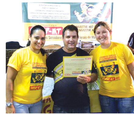
Entrega dos certificados