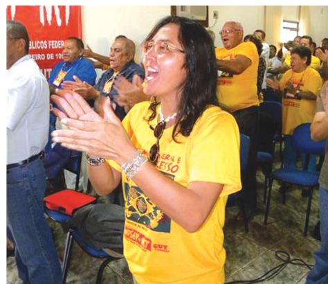
Momento de descontração dos delegados