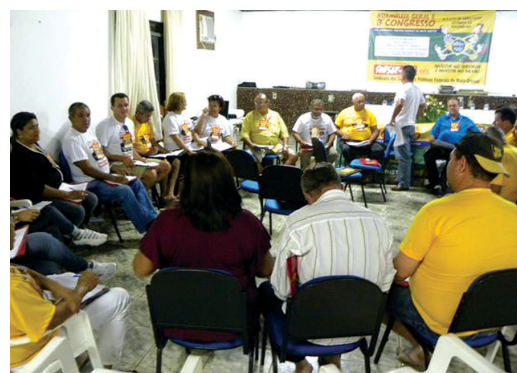
Grupo de trabalho no Congresso do Sindsep-MT