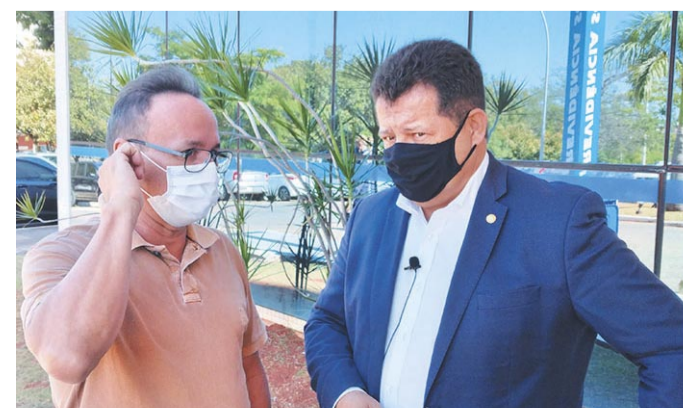
Valtenir também disse não em retirar direitos dos servidores