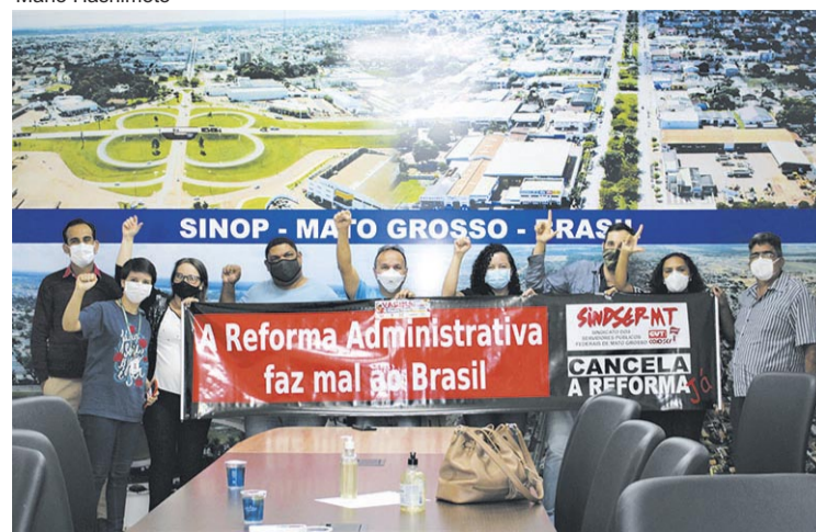
Movimentos sociais e sindicais dizem não à Reforma Administrativa