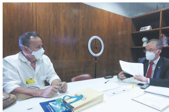
O Sindsep-MT foi bem recebido por Léo Brito, do Acre

Deputado Léo Brito (PT-AC) - A PEC 101, de autoria do deputado Mauro Nazif, é muito importante para o parlamentar porque ela faz justiça em relação aos sucaneiros. Pessoas que serviram ao estado brasileiro e infelizmente sofreram com a intoxicação relacionada ao DDT. “É nesse momento que o Estado precisa dar apoio a essas pessoas e a PEC prevê um