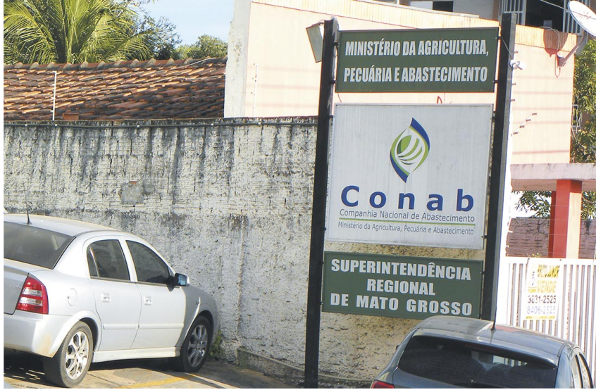
Empregados solicitam reajuste linear pelo índice do INPC/IBGE de 3,28%

Dois pontos centrais ainda geram impasse: a migração dos empregados para o plano de assistência à saúde Casembrapa e a interpretação jurídica da Lei Complementar 173/20 que está sendo usada pela empresa para negar qualquer reposição salarial aos empregados.