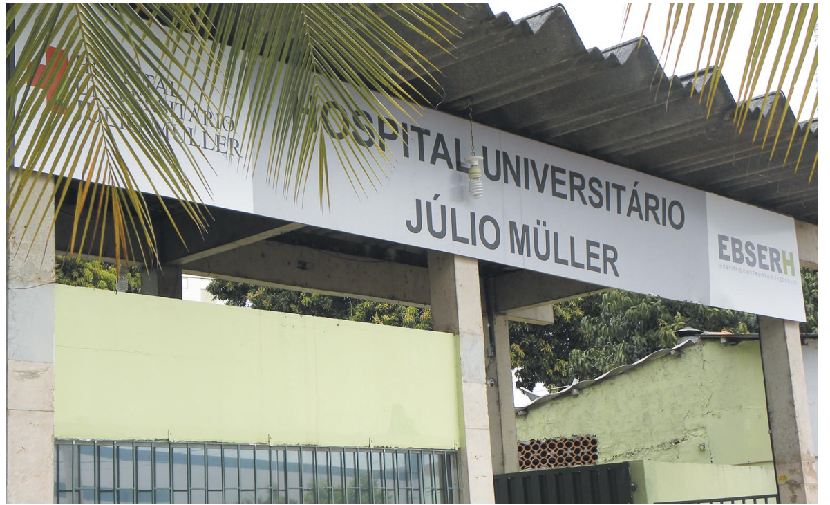
Em plena pandemia, Ebserh apresenta proposta considerada indecentes, que retira direitos dos empregados