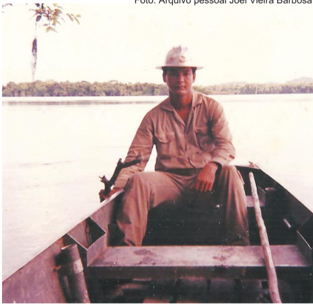
Servidor da Sucam enfrentava todo tipo de adversidades

O protesto desta terça-feira aglutinou trabalhadores de múltiplos setores, entre eles os de energia elétrica, abastecimento de água e esgoto, tecnologia da informação, comunicação pública e rede bancária. (Fonte: Brasil de Fato)